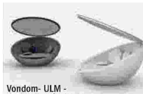
Vondom- ULM - design Ramòn Esteve

troduzione di un tassa che repentinamente andava a sostituire le 17 odiatissime gabelle (tasse) che solo poco prima erano state abrogate.