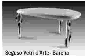
Seguso Vetri d'Arte- Barena design Pierpaolo Seguso