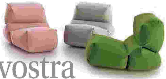
Gianblasco- Grapy design Kensaku Oshiro