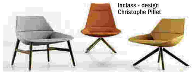
Inclass - design Christophe Pillet

poste dalla spagnola Inclass e disegnate da Christophe Pillet, con struttura in legno e scocca imbottita e rivestita in tessuto.