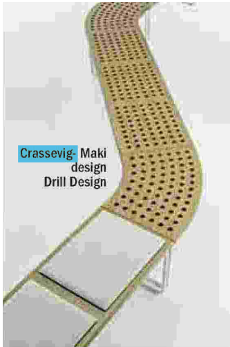
Crassevig Maki design Drill Design