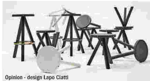
Opinion - design Lapo Ciatti