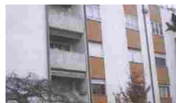
Appartamenti Venezia via Fratelli Bandiera 13